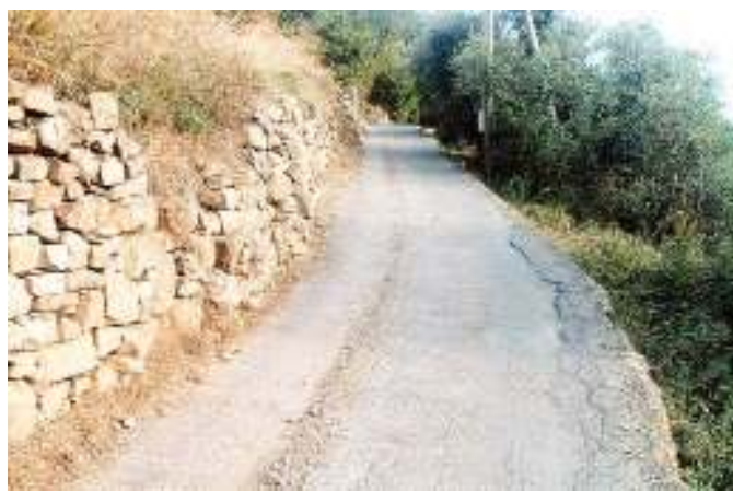
Un tratto della strada: tante le insidie e manca pure il guard-rail

A nulla sono valse finora le ripetute proteste che si sono levate dai residenti della zona: in Comune non hanno