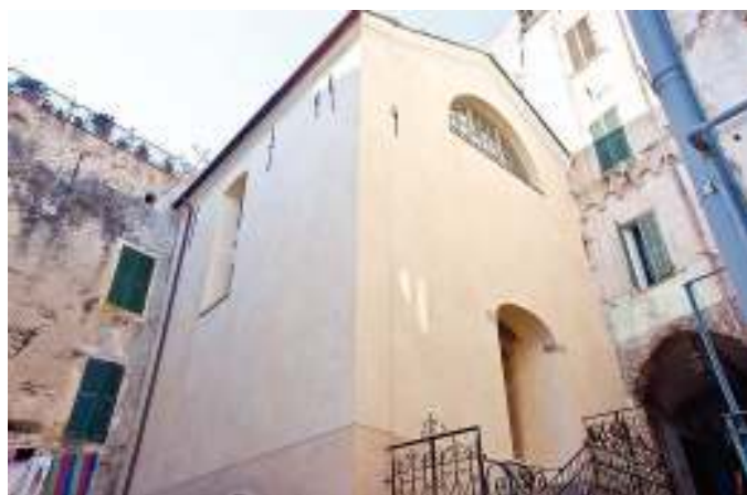
L'ex chiesa potrebbe ospitare una sala musicale per le band locali