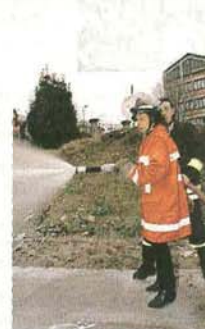
L'OMAGGIO A New York i vigili del fuoco ricorderanno i caduti dell'11 settembre