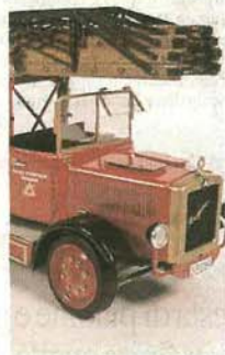
PEZZO DI STORIA L'autoscala dei pompieri genovesi, classe 1929, tuttora funzionante