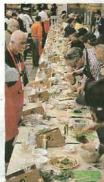
BASILICO E MORTAIO Sarà lo spazio di Eataly a ospitare l'anteprima del Campionato Mondiale