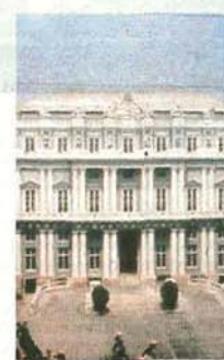
GRAN FINALE Da New York al Ducale per l'ultimo atto della sfida al pesto, il 17 marzo