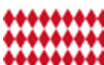
Principato di Monaco